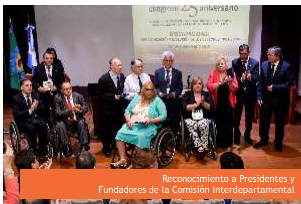
Reconocimiento a Presidentes y Fundadores de la Comisión Interdepartamental